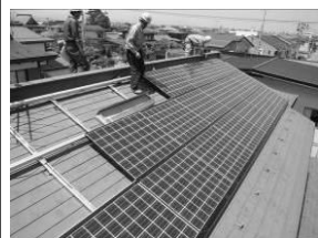
(山形市T様宅京セラ4.32kW 当社施工例)